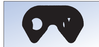
RPV- und RP-Zapfensystem mit sichelförmigen Zapfen

RPV-, RP- und SC-Zahnketten sind ausgerüstet mit dem patentierten Ramsey-Zapfensystem. Bestehend aus Wiegezapfen und Nietzapfen (Splintzapfen) bewirkt dieses Zapfensystem ein extrem ruhiges und vibrationsfreies Laufen der Zahnkette auch bei hohen Geschwindigkeiten, sowie einen Wirkungsgrad von 99 Prozent. RPV- und RP-Zahnketten sind ausgerüstet mit einsatzgehärteten sichelförmigen Zapfen, wogegen die SC-Zahnketten die D-förmigen einsatzgehärteten Zapfen aufweisen. Einzige Ausnahme ist die SC-Zahnkette mit 3/16-Zoll-Teilung. Diese Zahnkette wird mit einem Einfachzapfen ausgerüstet.