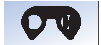
SC-Zapfensystem mit D-förmigen Zapfen